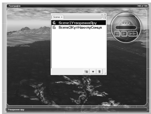
Мал. 3 – Модель, що містить 2 сцени: демонстрацію утворення яру і зміну кута нахилу сонця над горизонтом

1. Відеофайл чи файл растрового зображення повинні експортуватись без компресії. Як правило, Flash здійснює компресію під час фінальної стадії публікації з коефіцієнтом приблизно 1:400 для відеофайлів і 1:50 для растру. Це означає, що після публікації вихідних файлів по 100 Мб розмір їх зменшиться відповідно до 0,25 Мб і 2 Мб. Такий тип компресії ще називають стиснення із втратами інформації. Якщо до зображення чи відеофайла під час рендерингу застосовувалась компресія із втратами, то після публікації якість їх різко знижується, а розмір майже не зменшується. Якщо ж для виведення відеофайлу застосовувалась компресія без втрат, можуть виникнути проблеми під час імпорту відео до Flash.