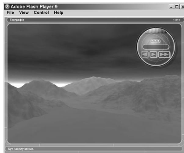
Мал. 2 – Типовий вигляд тривимірної моделі після публікації

Типовим випадком для збереження моделі в такому файлі є поширення анімації на CD чи DVD, а не через Інтернет. Проектори для Windows мають розширення exe, а для MacOS – hqx (мал. 2).