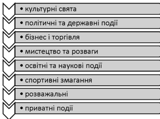
Рис. 3. Типологія запланованих подій (за D. Getz, 2005)

Типологія запланованих подій включає в себе культурні свята, політичні та державні події, бізнес, торгівлю, мистецтво та розваги, освітні та наукові події, спортивні змагання, розважальні та приватні події [рис. 3].