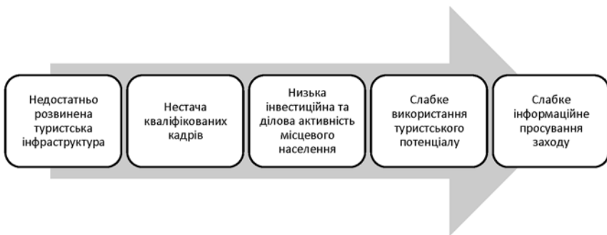
Рис. 2. Гальмуючі фактори розвитку подієвого туризму

Івент-менеджмент – це прикладна галузь вивчення і простір професійної практики, присвячене плануванню, проведенню і управлінню спеціальними заходами, такими, як фестивалі, різноманітні святкування, розваги, політичні і державні події, спортивні та пов'язані з мистецтвом івенти, заходи, які відносяться до бізнесу і корпоративних подій (зустрічі, наради, виставки), заходи, які відносяться до приватних (весілля, вечірки, соціальні,