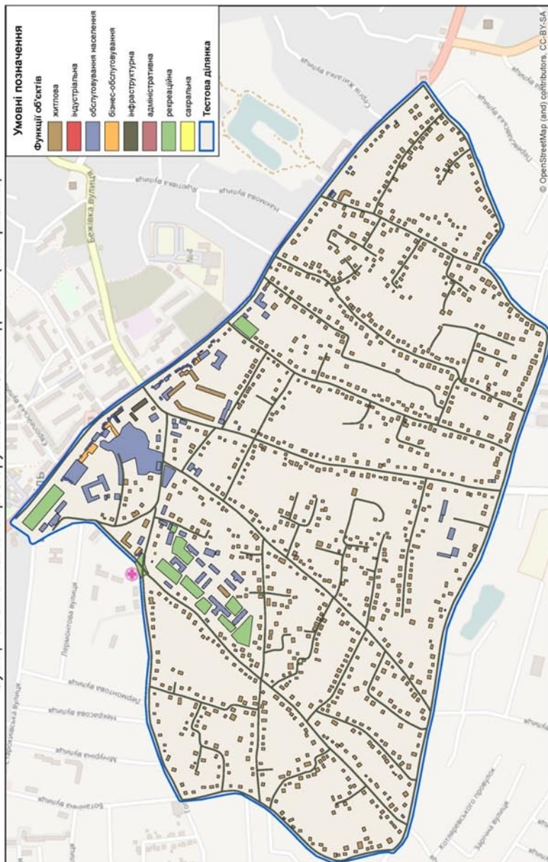
Рис. 1. Функції об'єктів міського простору в межах тестової ділянки в м. Бориспіль

Функції об'єктів міського простору в межах тестової ділянки (м. Бориспіль)