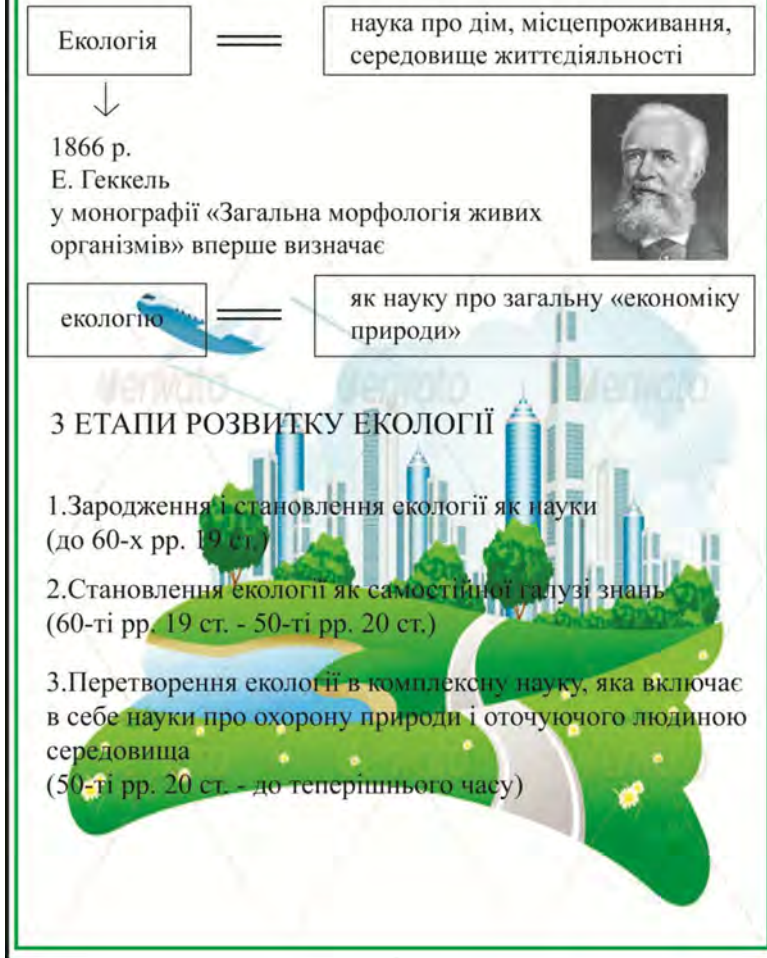
Рис. 3. «Екологія як наука про довкілля»

ідеї, реалії, перспективи: Збірник наукових праць / Ред. кол. Л.І.Даниленко та ін. – К. : Логос, 2000. – С. 158-160.