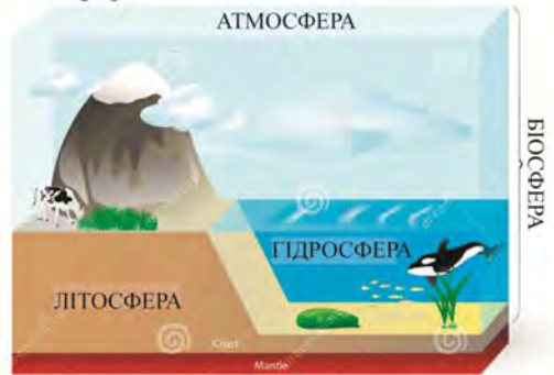
Рис. 2. «Біосфера, основні положення вчення В. І. Вернадського»

Біосферу визначають як область Земної кулі, що межує з Космосом, що сконцентрує в собі життя в різних формах його прояву. Вона займає всю гідросферу, верхні межі літосфери і нижні атмосфери.