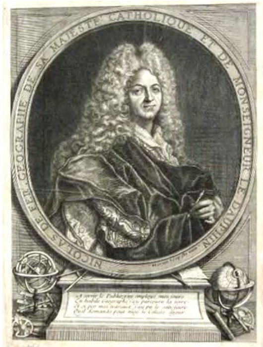
Рис. 1. Портрет Ніколя де Фера у виконанні Й. Бенара (J. Benard)

і видавцем свого часу: він створював плани міст, настінні карти, випустив понад 600 географічних карт, багато з яких були систематизовані в атласах. Особливу увагу картограф зосередив на створенні карт театрів воєнних дій (зокрема, війни за іспанський спадок), планів та описів європейських міст та їх укріплень, французьких провінцій, морських шляхів.