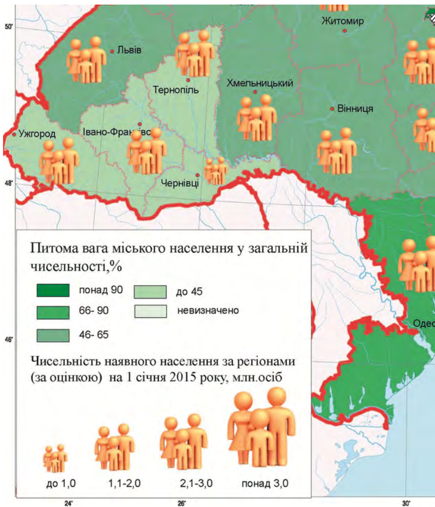
Рис. 2 Фрагмент створеної карти «Населення»

стовпчиками різного розміру. Також, за допомогою даного способу можна простежувати зміни одного показника на карті. Так при створенні карти «Статеві-віковий склад населення» було наочно показано чисельність постійного населення за окремими віковими групами за регіонами) на 1 січня 2015 року.