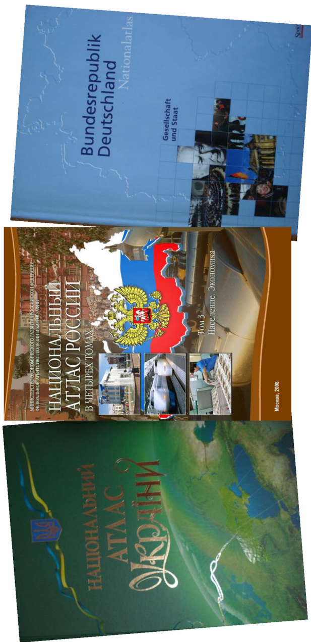
Рис. 1. Обкладинки НАУ, НАР, НАН