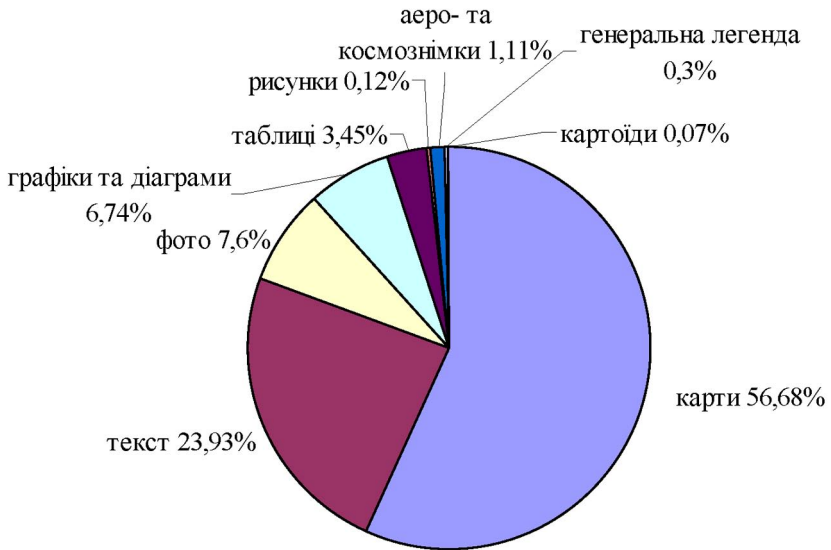
Рис. 3. Інформаційне ядро Національного атласу Росії