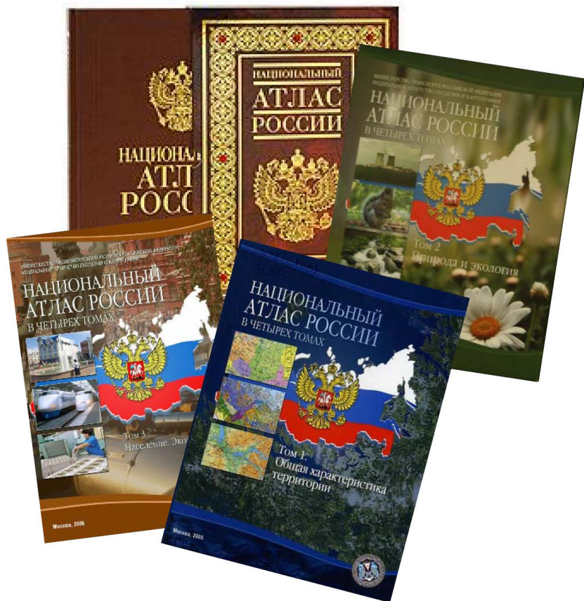
Рис. 1. Обкладинки Національного атласу Росії

Том складається з 496 сторінок текстової, картографічної та графічної інформації про населення та економіку Російської Федерації, а також про сформовані ними у взаємодії соціально-економічні системи. Увесь матеріал згрупований в 4 розділи: загальна характеристика Російської Федерації; населення і соціальний розвиток; господарство і економічний розвиток; регіони і регіональний розвиток.